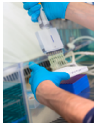
Laboratoire RESINFIT UMR-Inserm 1093 CHU.