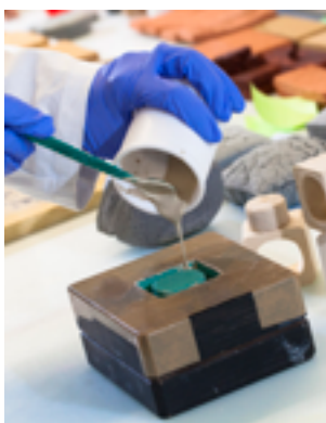
Laboratoire IRCER UMR CNRS 7315.