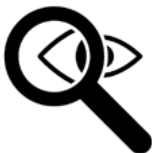
Created by HAMEL KHALED from Noun Project