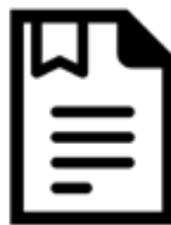
edited by MyunWoo from Noun Project