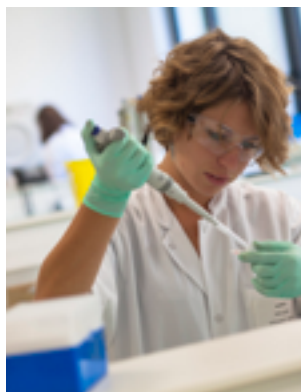
Laboratoire P&T Inserm U1248.