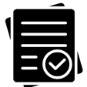
edited by ugh from Noun Project