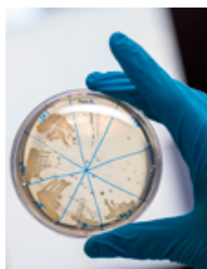
Laboratoire RESINFIT Inserm U1092.